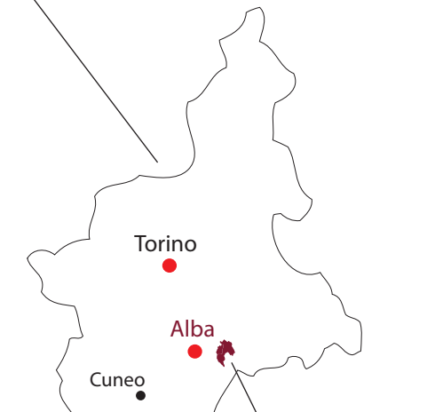
Zona di produzione del Barbaresco docg Barbaresco docg production zone